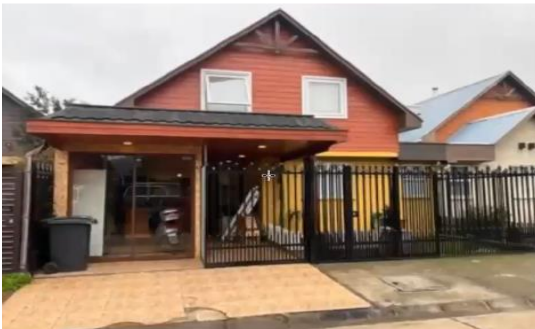
FOTOS DE LA VISITA INPECTIVA DE LA UNIDAD DE INSPECCION