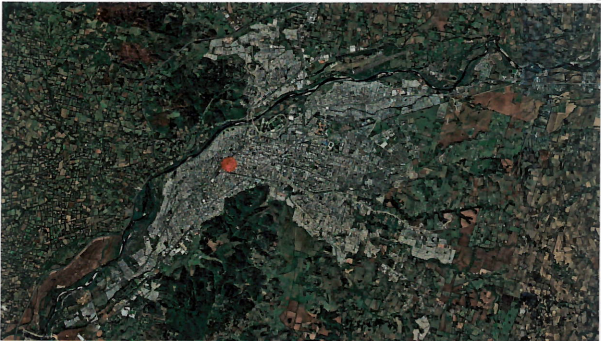
Temuco, Región de la Araucanía, Chile.

Un incendio, el paso del tiempo y el uso comercial que se le dio a la vivienda que se fue modificando en el tiempo, han llevado a que la casa no conserve prácticamente nada de la construcción original, más que su ubicación y la memoria del poeta.