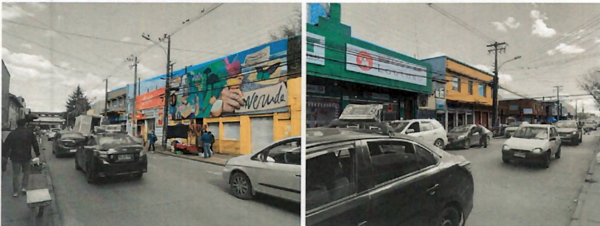
Vista calle Lautaro

En su contexto inmediato cabe destacar su cercanía con la Feria Pinto, edificio Marsano, y la estación de trenes. Barrio de carácter comercial (Sector Estación).