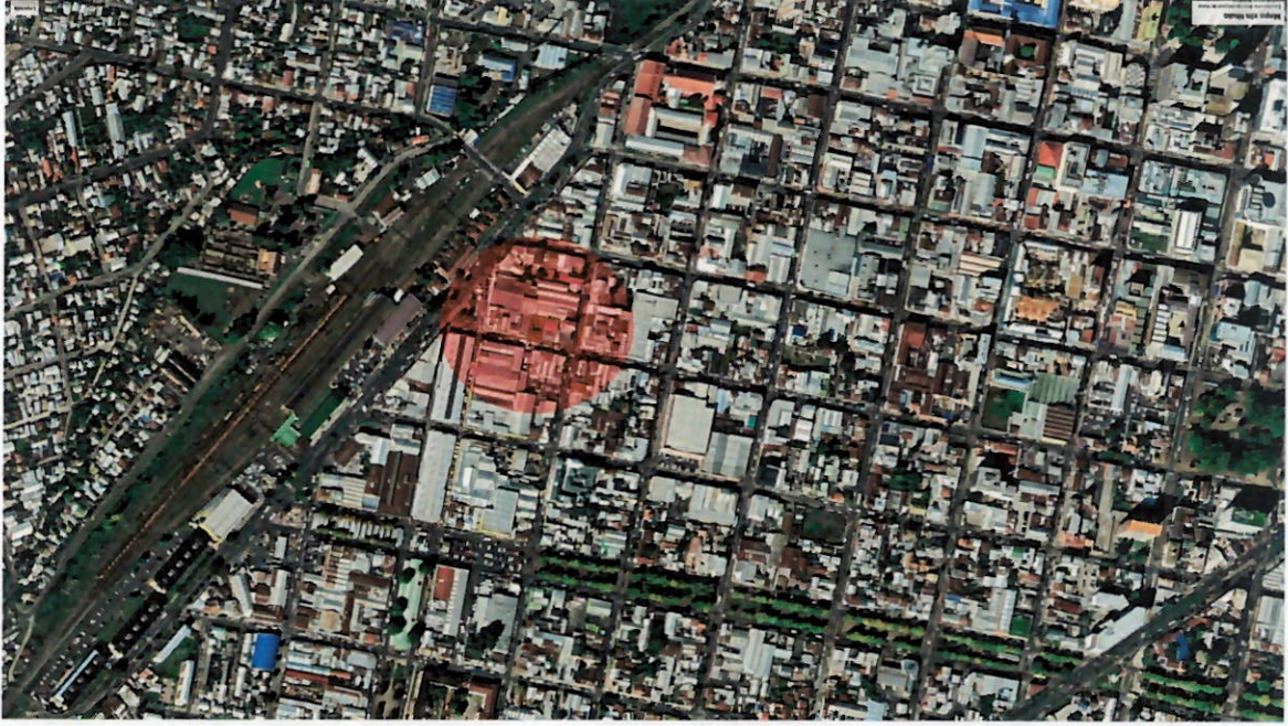
Ubicación casa de Infancia Neruda en Sector Estación, Temuco.