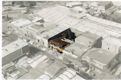
Imagen referencial ubicación casa

Ubicada en la Calle Lautaro N°1436 (vereda sur), en la actualidad la casa presenta un gran deterioro interior y en su fachada se hace presente el símbolo nerudiano del pez, una placa