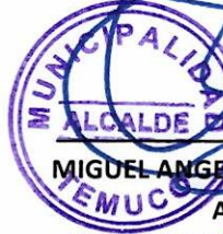
MIGUEL ANGEL BECKER ALVEAR ALCALDE MUNICIPALIDAD DE TEMUCO PRESTADOR DE ASISTENCIA TECNICA