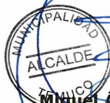
Miguel Ángel Becker Alvear Alcalde de la Comuna de Temuco