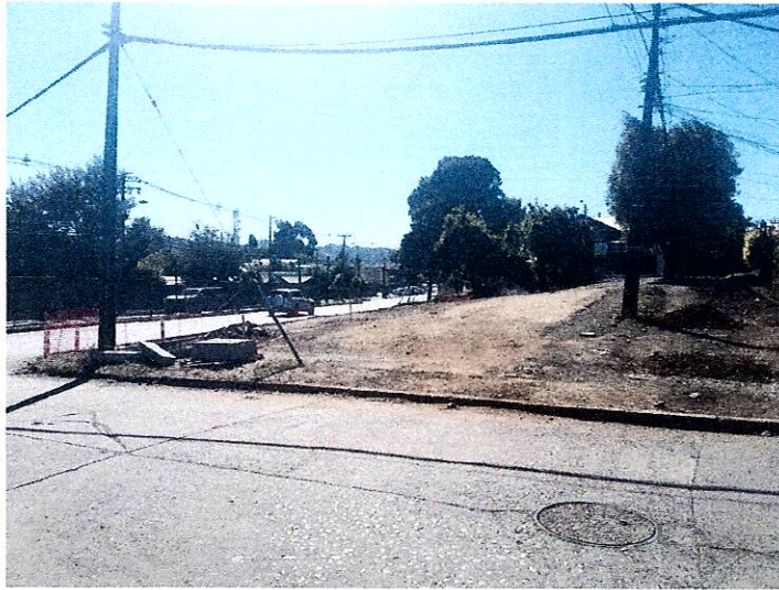
Ensanche Luis Durand, entre Chuquicamata y Javiera Carrera