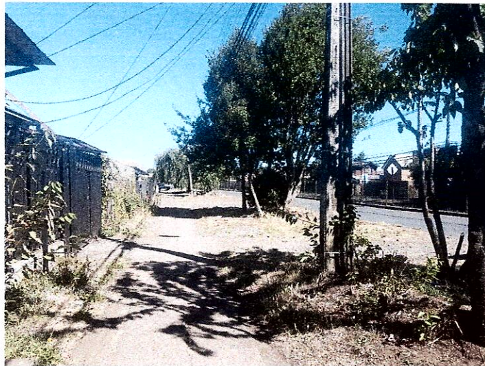
Ensanche Luis Durand, entre Chuquicamata y Javiera Carrera

Ruta Puerto Montt - Alerce Km 3,5 · X Región, Chile · Tel: (+56) 65 222 5100 · empresasln.cl