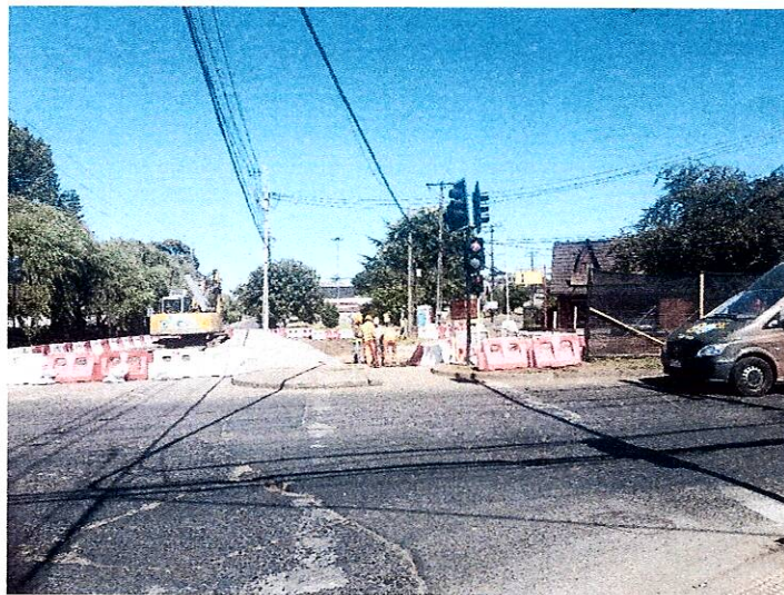
Plazoleta Poetas de Chile, Luis Durand esq. Gabriela Mistral.

Ruta Puerto Montt - Alerce Km 3,5 · X Región, Chile · Tel: (+56) 65 222 5100 · empresasln.cl