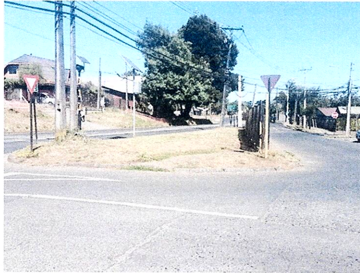
Plazoleta Santa Magdalena