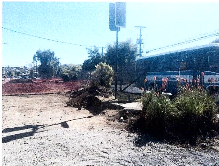
Bandejón Central Calle Andes, entre Inglaterra y Tromén

Ruta Puerto Montt - Alerce Km 3,5 · X Región, Chile · Tel: (+56) 65 222 5100 · empresasln.cl