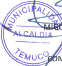
MIGUEL BECKER ALVEAR ALCALDE COMUNA DE TEMUCO