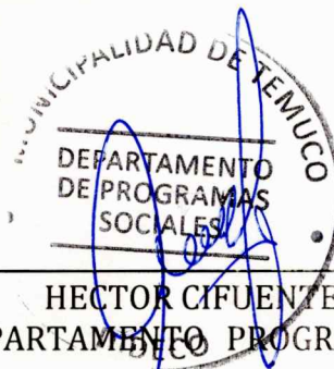
HECTOR CIFUENTES CAMPOS DEPARTAMENTO PROGRAMAS SOCIALES