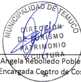
Angela Rebolledo Poblete Encargada Centro de Costo