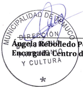
Angela Rebolledo Poblete Encargada Centro de Costos