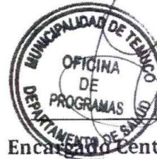
Encargado Centro de Costo