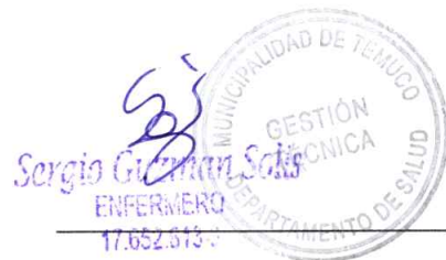
Jefe de Gestión Técnica