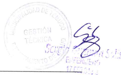
Jefe de Gestión Técnica