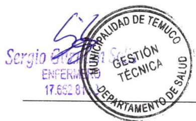
Jefe de Gestión Técnica