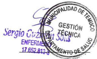
Jefe de Gestión Técnica