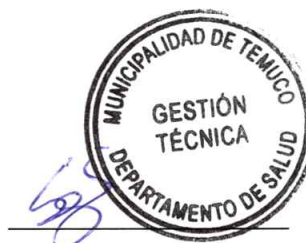
Jefe de Gestión Técnica