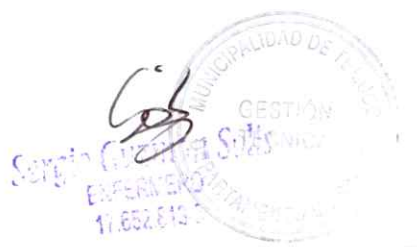
Jefe de Gestión Técnica