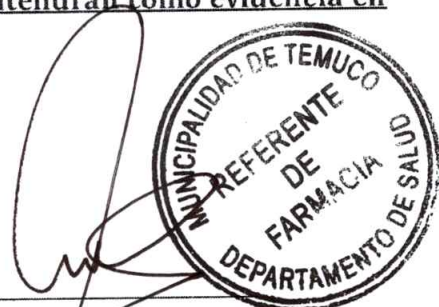
Evelyn Soto Saavedra Encargada FOFAR DSM Temuco