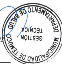
JEFE SECCIÓN GESTIÓN TÉCNICA