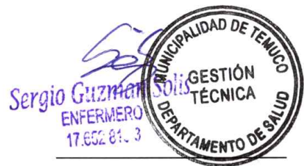
Jefe de Gestión Técnica