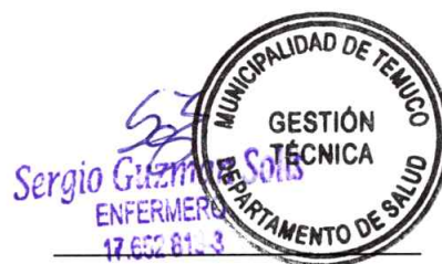
Jefe de Gestión Técnica