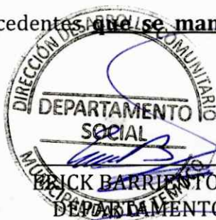
ENCK BARRIENTOS SEGUEL DEPARTAMENTO SOCIAL