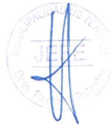
ENCARGADO CENTRO DE COSTOS