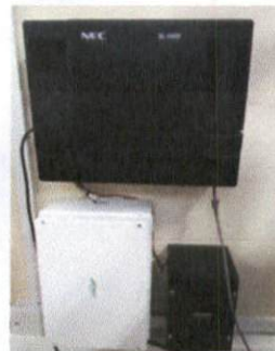
CENTRAL NEC SL 1000