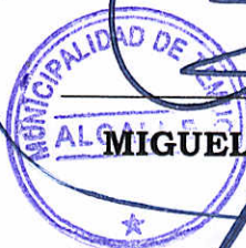
MIGUEL BECKER ALVEAR ALCALDE MUNICIPALIDAD DE TEMUCO

72 MUNICIPALIDAD DE TEMUCO Dpto. Vivienda Desarrollo Comunitario