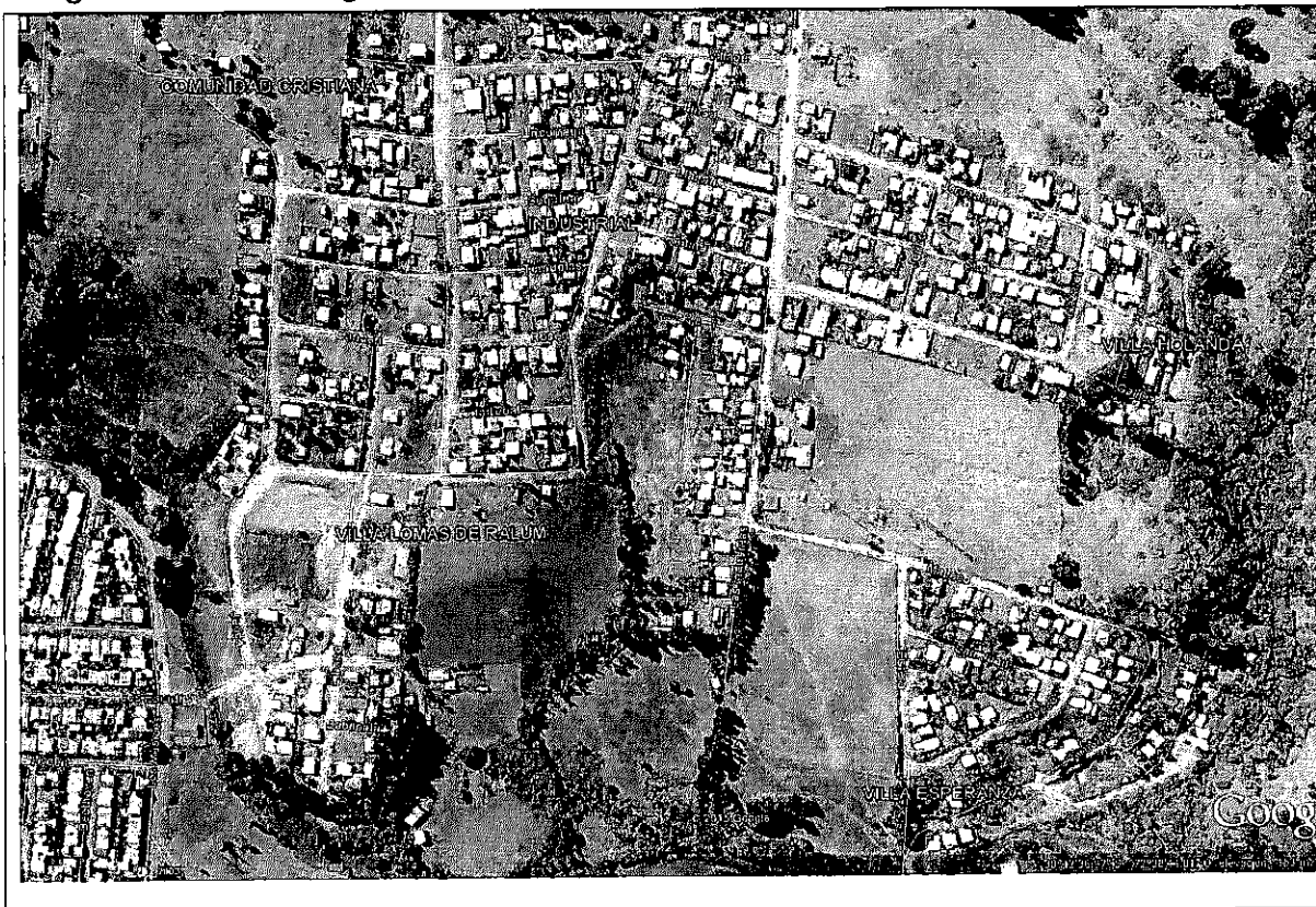
Polígono N°1: Loteos Irregulares Camino Chol-chol

Considerando el plan piloto de la SEREMI, expuesto en la cláusula precedente, consistente en otorgar financiamiento a proyectos de ingeniería como, asimismo, la mayor concentración de loteos irregulares existente en el sector camino a Chol Chol, se contempla, en una primera etapa, la Zona geográfica que corresponde a los siguientes loteos irregulares: Lomas de Ralum, Villa Industrial, Villa Comunidad Cristiana, Villa Holanda y Villa El Estero