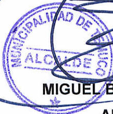
MIGUEL BECKER ALVEAR ALCALDE MUNICIPALIDAD DE TEMUCO