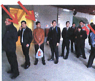
Fot.1: 2 personas.

En este encuentro se aprecia uso parcial de vestimenta requerida, por algunos Guardias y Controles. Existen 10 personas que no utilizan uniforme requerido, conforme el registro fotográfico.