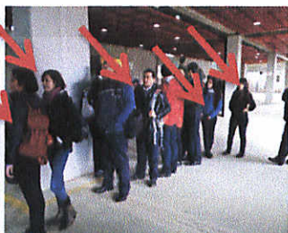
Fot.2.: 5 personas