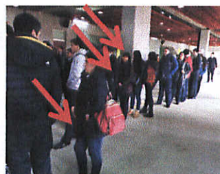
Fot.3: 3 personas