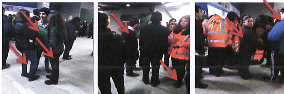
Fot.1: 3 personas

En este encuentro se aprecian 7 personas que no utilizan uniforme requerido, conforme el registro fotográfico.