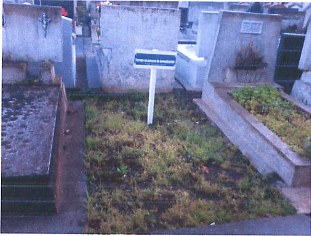
PATIO 30 , SEPULTURA No 53 , 3,6 mts 2 .