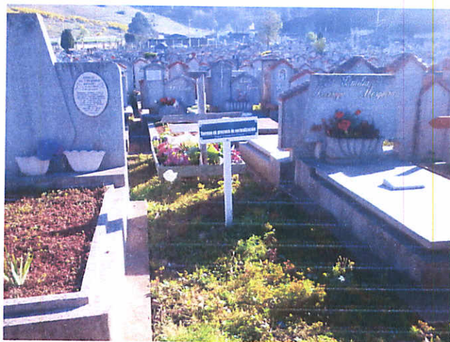
PATIO 41, FILA 6 NORTE , SEPULTURA No5 PONIENTE, 3,5 mts2