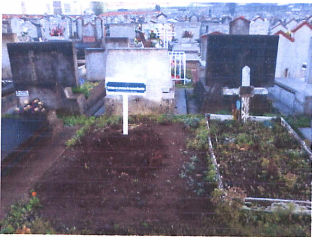
PATIO 34, SEPULTURA No 139, 3,5 mts 2.