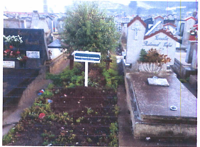
PATIO 34, SEPULTURA No42, 3,5 mts 2.