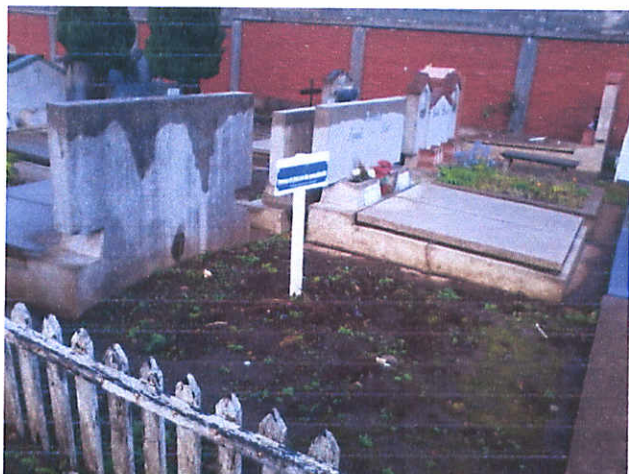
PATIO 40, FILA 6 SUR , SEPULTURA No2 , 5,5mts 2