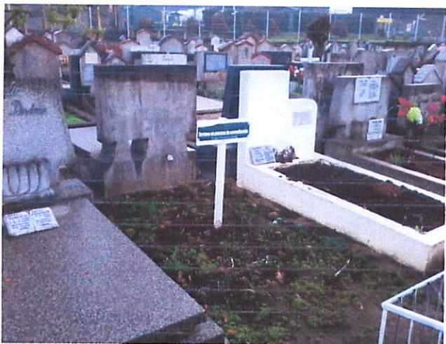
PATIO 40, FILA 7 SUR, SEPULTURA No8 , 5,5 mts.2