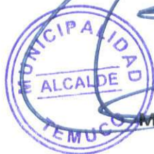
MIGUEL BECKER ALVEAR ALCALDE COMUNA DE TEMUCO