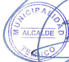
MIGUEL BECKER ALVEAR ALCALDE MUNICIPALIDAD DE TEMUCO