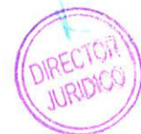
MIGUEL BECKER ALVEAR ALCALDE