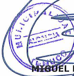
MIGUEL BECKER ALVEAR Alcalde Municipalidad de Temuco

NOVENO: El presente convenio se otorga en cuatro ejemplares del mismo tenor, quedando dos en poder de la Dirección Regional del Consejo Nacional de la Cultura y la Artes Región de la Araucanía y dos en poder de la Municipalidad de Temuco.