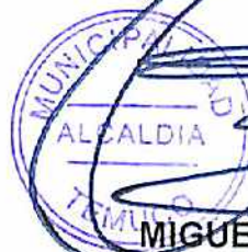
MIGUEL BECKER ALVEAR ALCALDE I. MUNICIPALIDAD DE TEMUCO