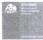
TABLA DE EVALUACIÓN